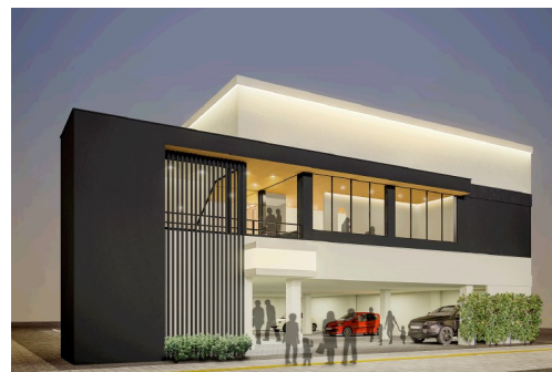
※木曽路熊谷店イメージ画像です

店舗名 : しゃぶしゃぶ・日本料理 木曽路熊谷店 開店日 : 2019年1月23日(水) 所在地 : 埼玉県熊谷市本町一丁目77番地 営業時間 : <平日・土曜>11:30~15:00 (L O14:30) 17:00~22:00 (L O21:00) <日曜・祝日>11:30~22:00 (L O21:00) 定休日 : 年中無休 席数 : 144席